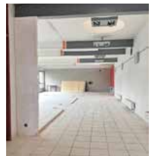
Travaux du centre socioculturel Imagine

Les services support du centre socioculturel sont hébergés dans le logement et le bureau du théâtre.