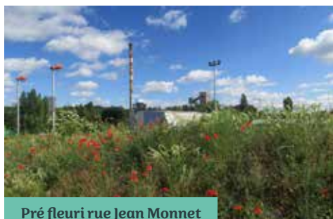
Pré fleuri rue Jean Monnet

La municipalité a décidé de s'engager dans la démarche « Commune nature » qui vise à protéger la nature et l'eau et promouvoir la biodiversité.