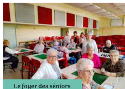
Le foyer des séniors