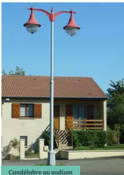
Candélabre au sodium

La décision a été unanime : l'éclairage public a été rétabli. Il a aussi été décidé de changer les 170 points lumineux restants pour passer à l'éclairage LED.