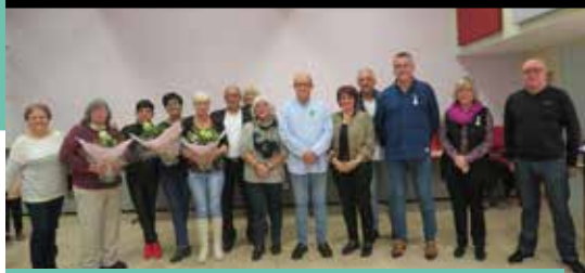
Les médaillés et les retraités de l'année 2022