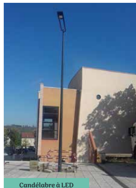
Candélabre à LED