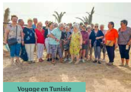
Voyage en Tunisie